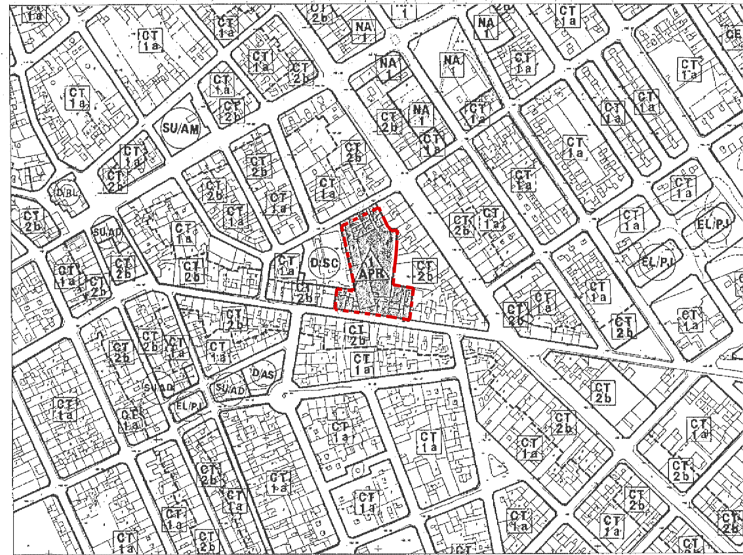
CALIFICACION SEGUN PLAN GENERAL