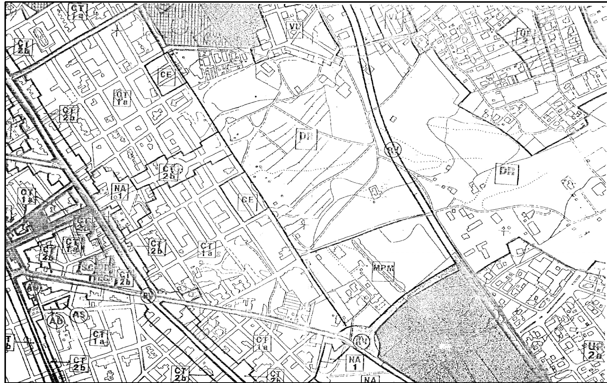
SITUACIÓN s/. PLANO DE CALIFICACIÓN DEL P.G.O.U. DE SAN VICENTE DEL RASPEIG