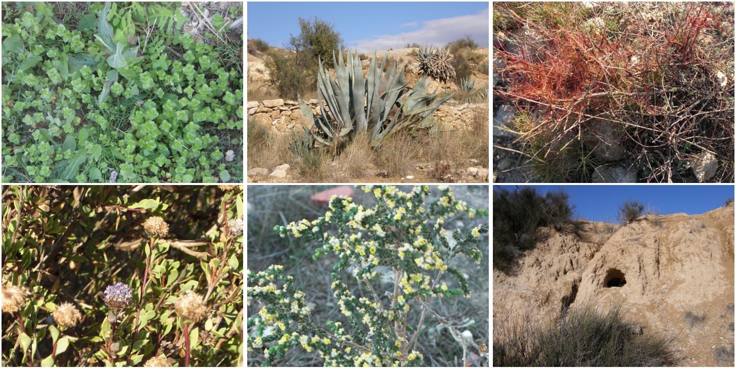
1. Uletrera 2. Pitera 3. Cabells 4. Saullà 5. Palmarina 6. Cau de rabosa