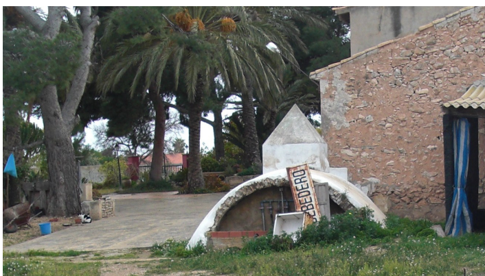
Aljub de Casa Quelo

Després l'itinerari segueix pel Camí dels Jovers fins a trobar el Vial dels Holandesos, topònim que respon a l'antic projecte de fixar turistes d'eixa nacionalitat en l'espai que hui es denomina Villamontes