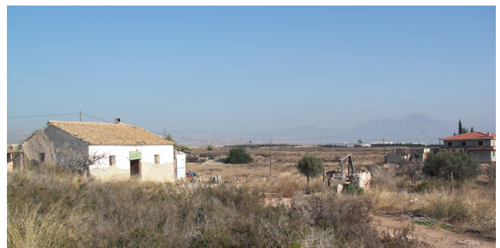
Itinerari de tornada: camí de Boronat