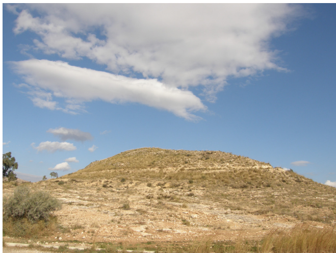
Vessant sud de la Llometa Redona