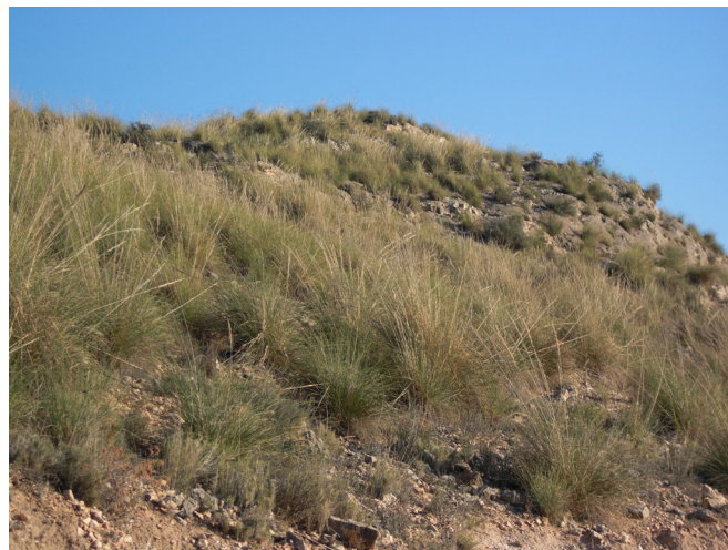
Espartar de la Llometa Redona

Caminant per la senda que rodeja completament la Llometa s'obté una visió panoràmica del Camp d'Alacant i el cinturó muntanyós que l'envolta.