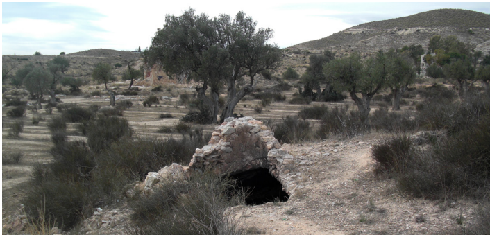
Aljub de Lo Brotons