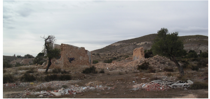
Ruïnes de Casa Brotons i la Llometa Redona

Des de l'any 1857 es documenta la busca de pous d'aigua en la zona amb la constitució de la societat El Diluvio. En tota l'àrea queden empremtes d'esta activitat que es va prolongar fins fa unes dècades.