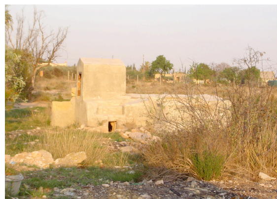
Aljub en la partida de Boqueres