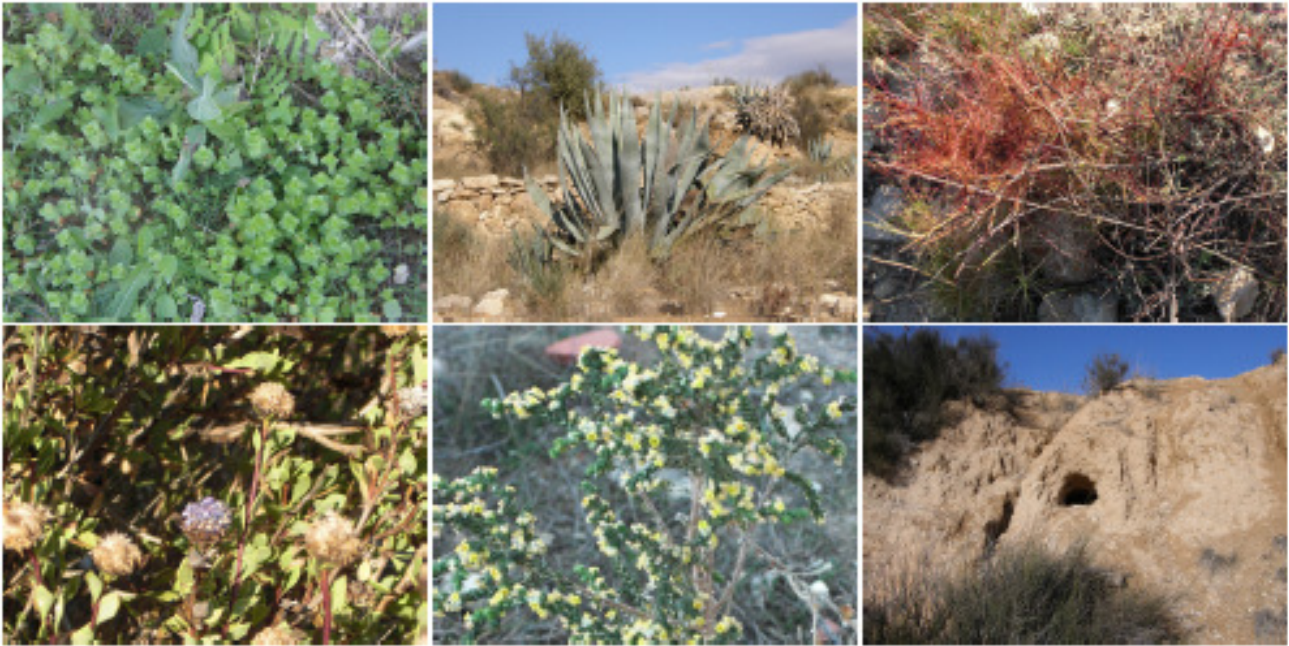
1. Euphorbia 2. Pitera 3. Cuscuta 4. Coronilla de fraile 5. Bolaga 6. Madrigera de zorro