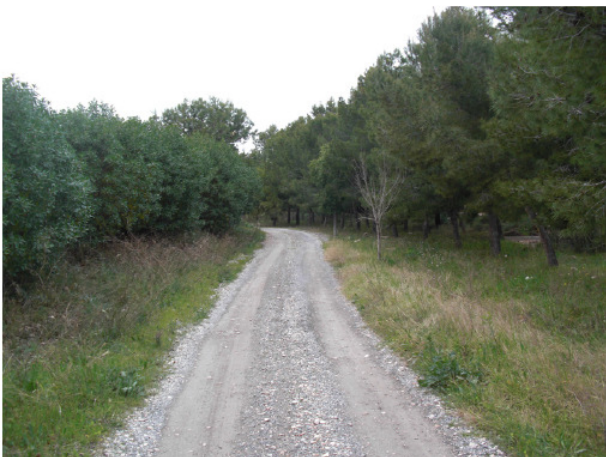
Aspecto actual de la antigua Cañada Real

Actualmente Cañada Real ha sido homologada como sendero "PR-CV 282 Camí de la Sendera", por parte de la Federación de Deportes de Montaña y Escalada de la Comunidad Valenciana (FEMEVCV). Este sendero homologado tiene una longitud de 16,7 kilómetros, y su inicio se sitúa en el parque Hort de Torrent y su fin en Monnegre Alto.