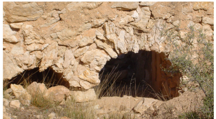
Doble arco en el sistema de salida de agua

La boquera consiste en una acequia que nace de la rambla, y que a través de varios brazos distribuye el agua de las crecidas de los torrentes (normalmente secos) entre los campos de cultivo, o incluso, puede ser canalizada hacia un aljibe u otro elemento constructivo relacionado con el aprovechamiento hídrico.