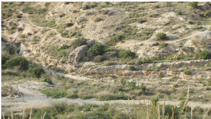
Muro de contención

La Boquera de la Llometa Redona es un elemento singular que une su valor medioambiental con el histórico, puesto que está datada en protocolos notariales desde el siglo XVIII. La existencia de un paisaje cruzado por ramblas dio lugar desde muy antiguo (hay quién remonta estas prácticas a tiempo de los romanos o de los moros) a sistemas de aprovechamiento del agua de derramamiento en un espacio caracterizado por las escasas precipitaciones. Precisamente, una parte del itinerario previsto transcurre por la Partida de Boqueres, que recibe este nombre por la existencia de varios de estos sistemas de riego en el territorio.