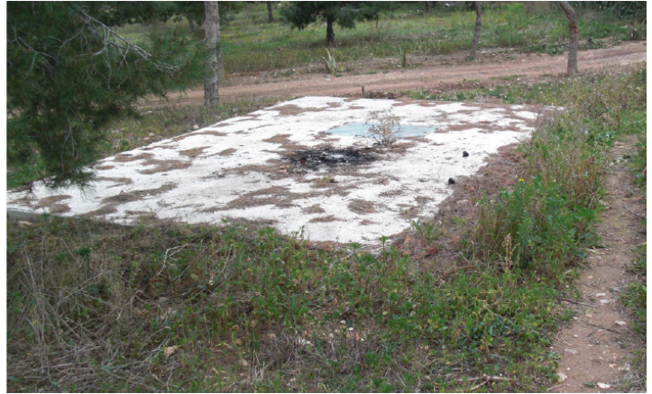
Entrada al refugio de La Borinque. Se pueden apreciar los escalones de bajada. Localización de la entrada al refugio