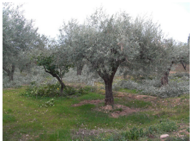
Poda de olivos junto a Cañada

En el área de influencia de Cañada Real, en este tramo del Camí de la Sendera, hay varias edificaciones rurales (situadas actualmente en el área periurbana) que constituyen una muestra viva de la vivienda tradicional del campo sanvicentero. Estas viviendas se construyeron en su