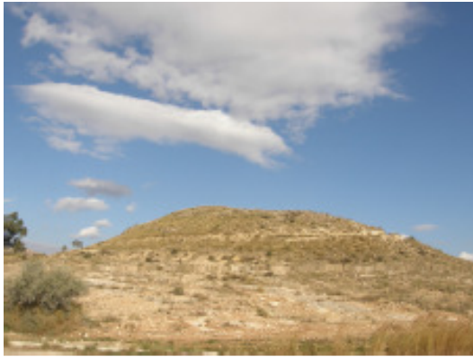
Vertiente sur de la Llometa Redona