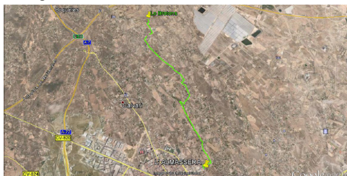
Itinerario de regreso

El retorno será por la Casa del Soldado-Camí de Boronat-Camí de les Coves-Camí de Soca-Paratge de Alcaraz-La Almàssera, con un recorrido de 5,2 kilómetros.