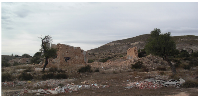
Ruinas de la Casa Brotons y la Llometa Redona

Desde el año 1857 se documenta la búsqueda de pozos de agua en la zona con la constitución de la sociedad El Diluvio. En toda el área quedan huellas de esta actividad que se prolongó hasta hace unas décadas.