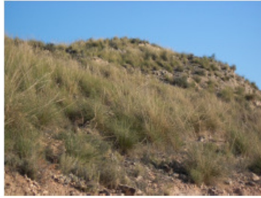
Aljibe en la partida de Boquera-

Andando por la senda que rodea completamente la Llometa se obtiene una visión panorámica del Camp d'Alacant y el cinturón montañoso que lo rodea.