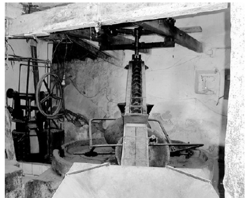
Diario Información, 24 de noviembre de 2006 y 10 de julio de 2007.

Cómo señala la memoria del catálogo, la almazara formaba parte de un conjunto formado por la casa principal destinada a vivienda, patio y corrales, gran aljibe, la almazara mencionada y la era. Se ha integrado en una plaza donde se conserva el aljibe y la planta de la casa, con una plantación de olivos.