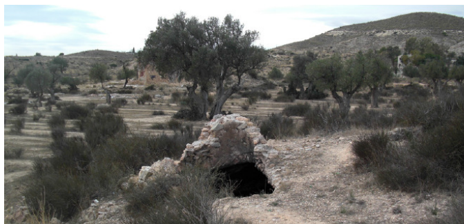
Aljbe Lo Brotons