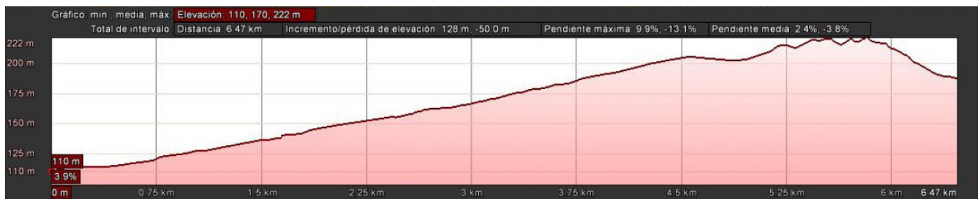
Perfil del itinerario medioambiental L'Almàssera-Llometa Redona

El itinerario L'Almàssera-Llometa Redonda transcurre por las partidas del Raspeig y Boqueres del término municipal de San Vicente del Raspeig. Los aproximadamente siete kilómetros ejemplifican las posibilidades y límites de la relación naturaleza-hombre en el devenir histórico del territorio. La comprobación de la coexistencia del antiguo aprovechamiento ganadero y agrícola, la observación de elementos característicos de la cultura del agua en el secano mediterráneo (con la construcción de "boqueres", aljibes y vertientes) y la identificación de varios ecosistemas característicos de la maquia mediterránea como el espartal, la rambla o el tomillar.