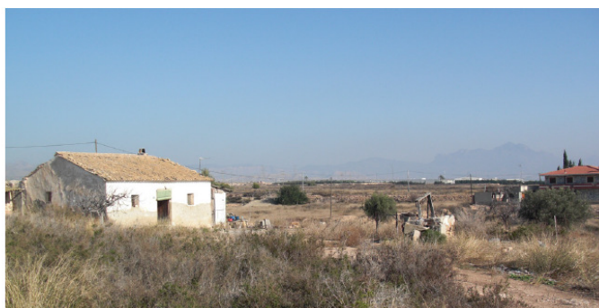
Itinerario de regreso: Camí de Boronat